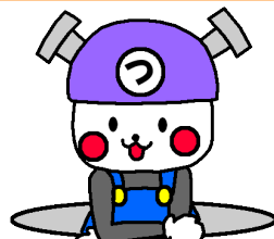
坂戸、鶴ヶ島下水道組合 キャラクター 「さかげ」と「つるげ」